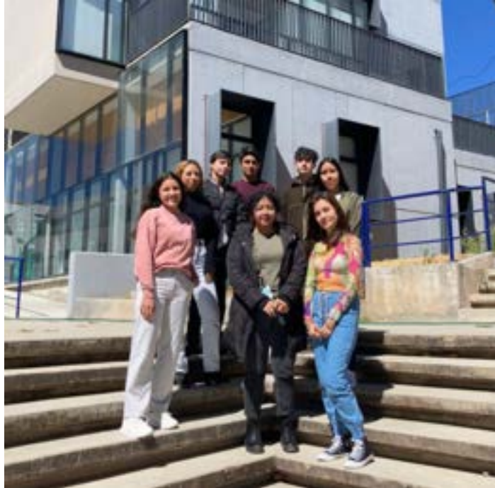
Figura 8. Estudiantes del PLCS Generación 2021 - 2025