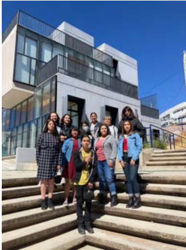
Figura 12. Estudiantes del PLCS Generación 2019 - 2023