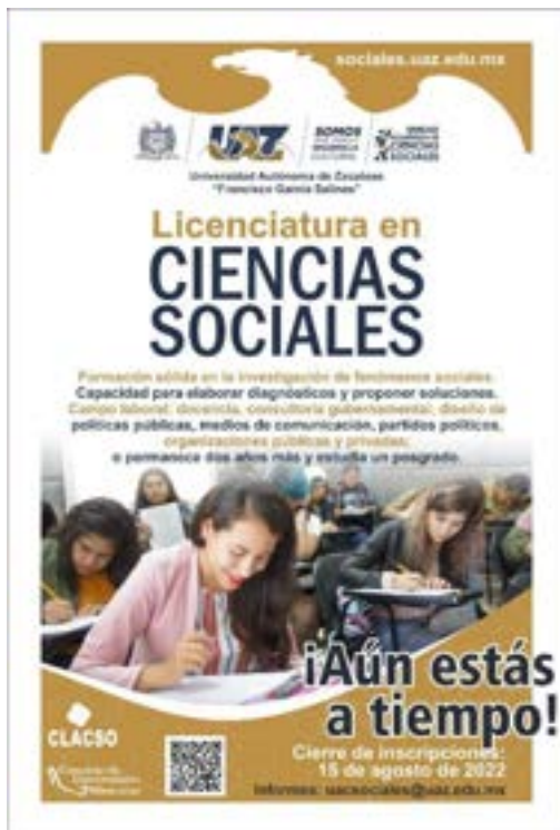
Figura 18. Cartel publicitario para convocar aspirantes de nuevo ingreso en el PLCS en agosto de 2022