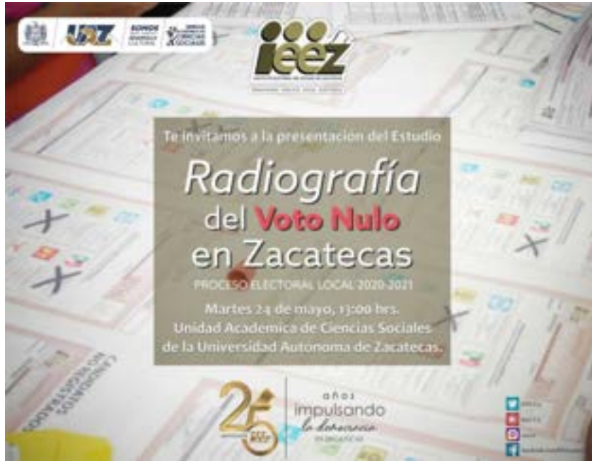
Figura 28. Invitación a la presentación del Estudio “Radiografía del Voto Nulo en Zacatecas”