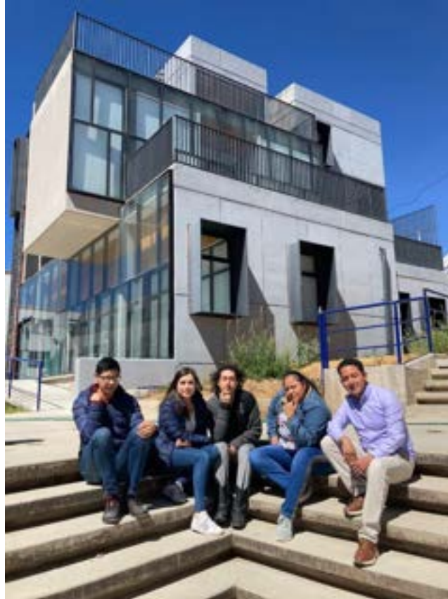
Figura 10. Estudiantes del PLCS Generación 2020 - 2024