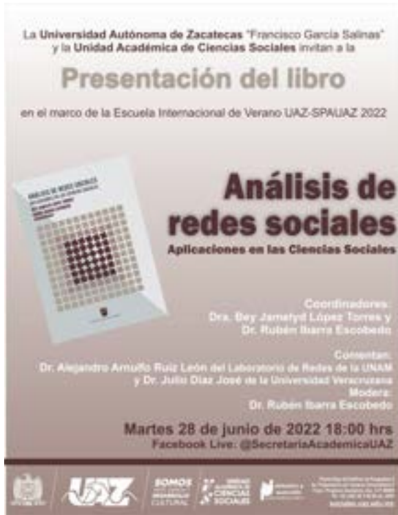
Figuras 30. Póster de difusión de la presentación del libro “Análisis de redes sociales”