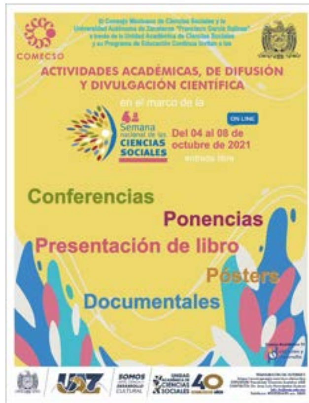
Figura 24. Póster promocional de la 4ta Semana Nacional de las Ciencias Sociales