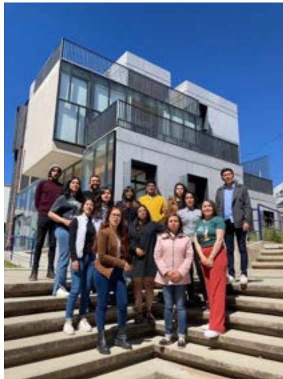
Figura 14. Estudiantes del PMCS Generación 2021 - 2023