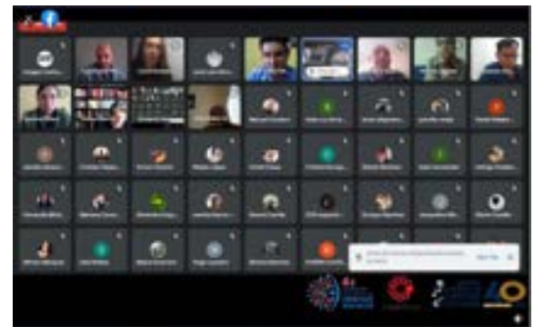
Figura 25. Actividades virtuales de la 4ta Semana Nacional de las Ciencias Sociales