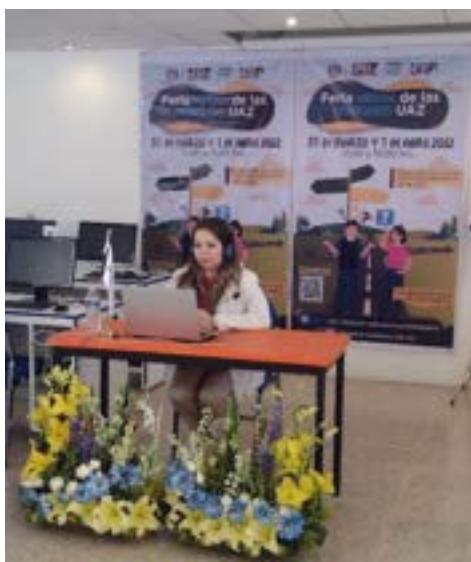
Figura 20. Participación en las actividades de promoción del PLCS en la Feria virtual de profesiones UAZ 2022