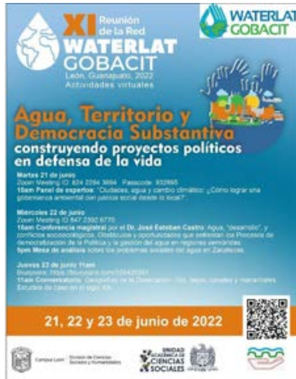
Figura 29. Invitación a la XI Reunión de la Red WATERLAT GOBACIT

Este evento, que fue transmitido mediante diferentes plataformas digitales, contó con un panel de expertos, una conferencia magistral y un conversatorio. En la figura 29 se puede apreciar el póster para la difusión.