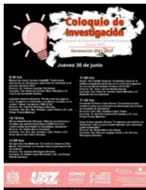
Figuras 32 y 33. Programa del Coloquio de investigación de verano 2022