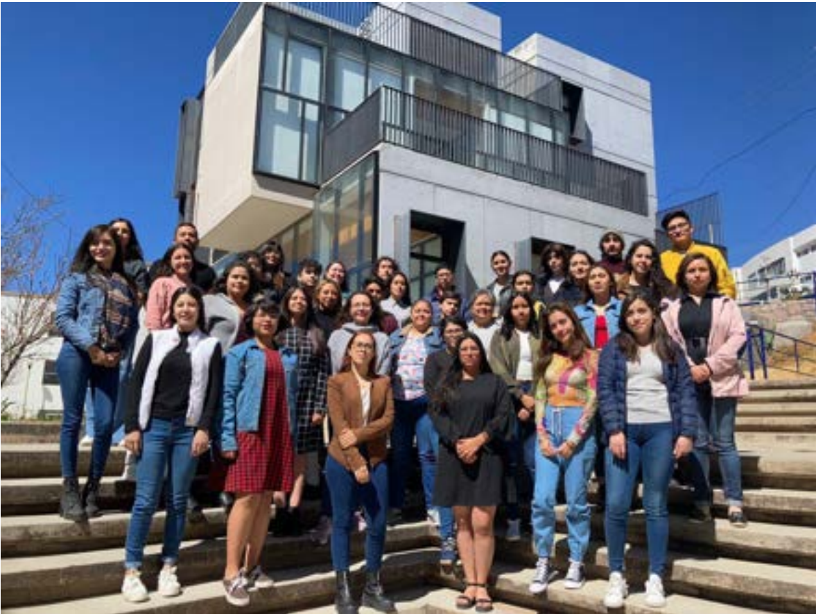
Figura 5. Estudiantes de los Programas de Licenciatura y Maestría en Ciencias Sociales (Marzo de 2022)

Este apartado corresponde a todas las actividades de docencia, tutoría así como los procesos de promoción, selección e ingreso de estudiantes de nuevo ingreso.