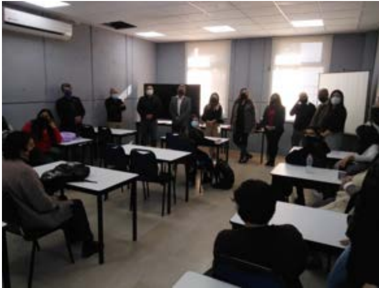
Figura 6. Regreso a clases presenciales luego de casi dos años de confinamiento

Los grupos del programa de licenciatura, durante los ciclos lectivos agosto - diciembre 2021 y enero - junio 2022, han estado conformados como se muestra en las figuras 7 a 12: