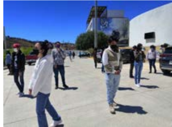
Figuras 26 y 27. Taller “Lo que niegas te somete, lo que aceptas te transforma. Resignificación de la Ansiedad y Manejo del Estrés en el proceso de adaptación a la nueva normalidad”

El 24 de mayo, el Instituto Electoral del Estado de Zacatecas presentó en la UACS un estudio acerca del voto nulo en la entidad. Asistieron estudiantes de ambos programas, así como público interesado en el tema.